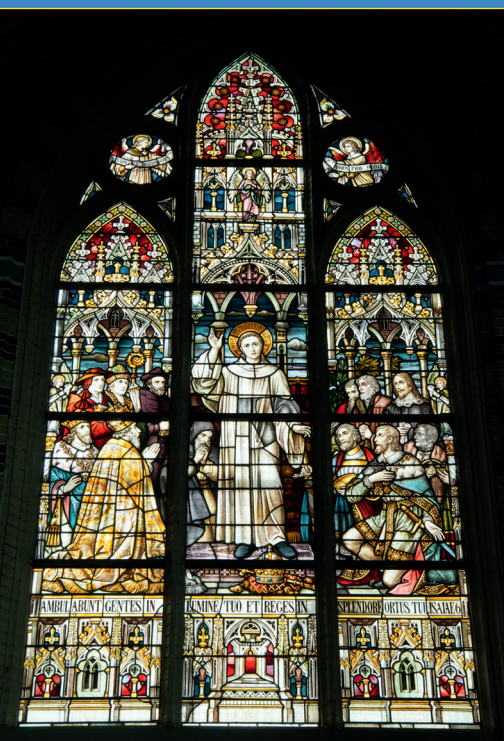
8 GLAS-IN-LOODRAAM IN SINT-LAURENTIUSKERK, OUD GASTEL